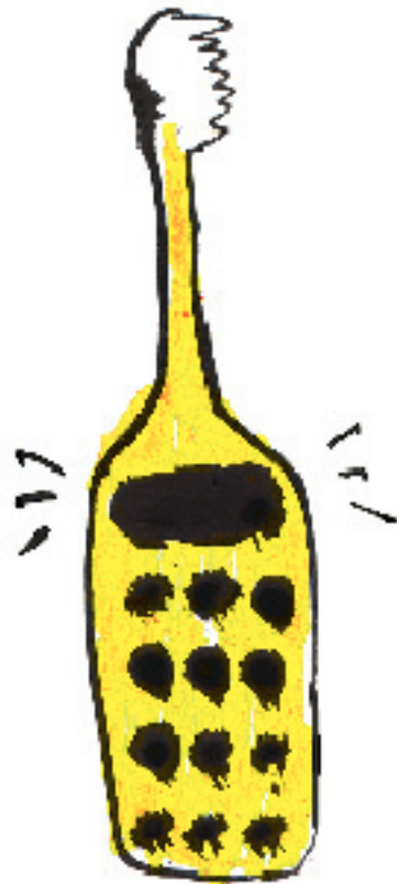
em forma de telefone