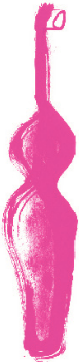
a da mãe