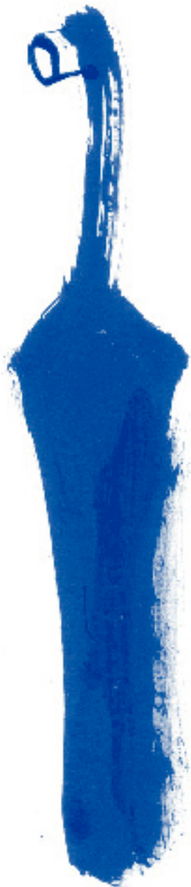
a do pai