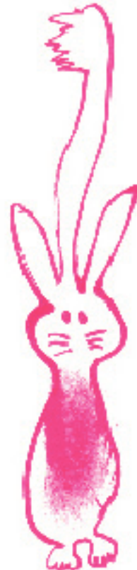
em forma de animal